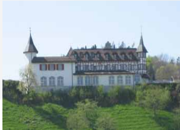
Dancing Klein Rigi